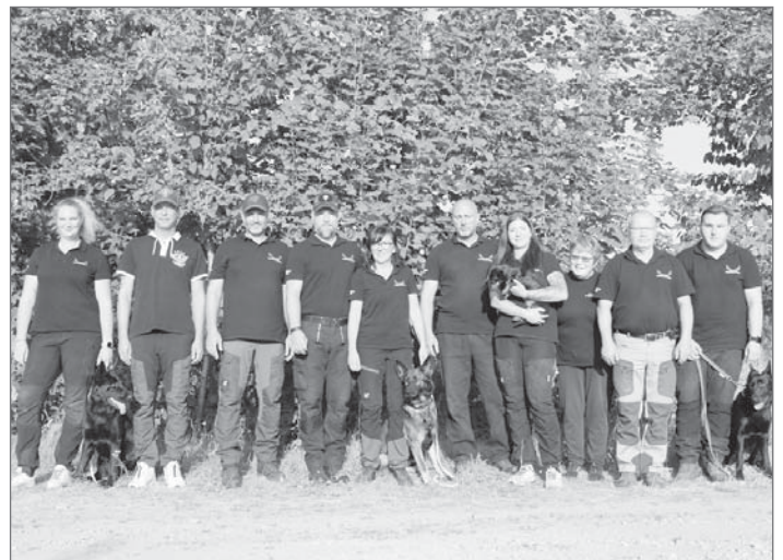
Teilnehmer des Trainingslagers