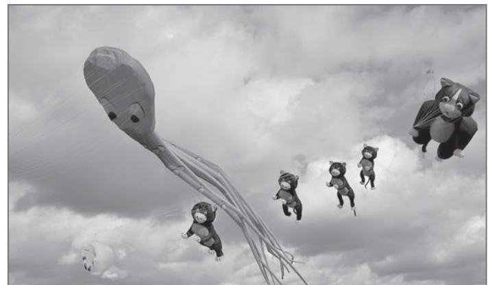
Alberstedter Heimat- und Kulturverein

Am Samstag, 12. Oktober, 15.00 Uhr, lädt der Alberstedter Heimat- und Kulturverein zum Drachenfest nach Alberstedt ein. Bei schönem Herbstwetter, ohne Regen, lassen wir die Drachen steigen, backen Knüppelkuchen, essen eine Roster oder ein Stückchen Kuchen. Der Durst kann natürlich auch gelöscht werden. Wir erwarten unsere Gäste am Ortseingang von Farnstätt kommend und freuen uns auf Sie.