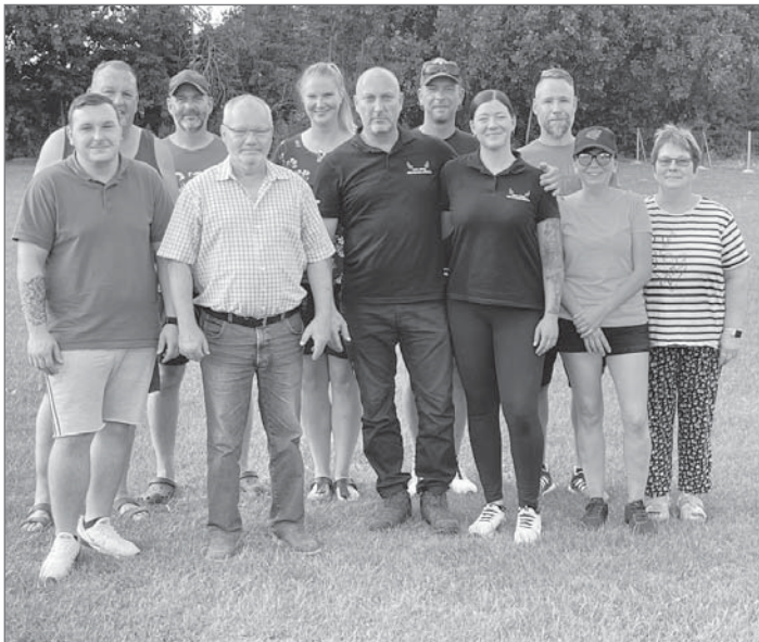
Gründungsmitglieder des SV OG Barnstädt

Bereits am 31.08.2024 war es soweit. Insgesamt 4 Hunde vom Trainingsplatz Barnstädt wurden erfolgreich zur Wesensüberprüfung in Wimmelburg vorgeführt. Der Zuchtrichter lobte die wesensstarken Hunde aus dem Zwinger „Von den Weidateufeln“ und vergab für die „Barnstädter“ Bestnoten. Dies war für die Hundesportler aus Barnstädt der Lohn für die zahlreichen Trainingseinheiten und musste natürlich entsprechend gefeiert werden. So wurde unmittelbar nach der Wesensbeurteilung ein „Trainingslager“ mit Übernachtung im Zelt auf dem Hundesportplatz durchgeführt. Natürlich wurde der Erfolg mit einem „Grillerchen“ und bei einem Glas Bier oder Sekt gefeiert und ausgewertet. Zudem wurden einige Spiele und Wettkämpfe absolviert